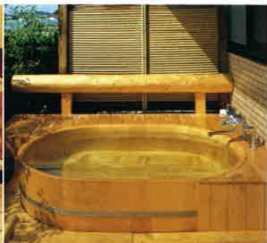
東京老人ホーム露天風呂