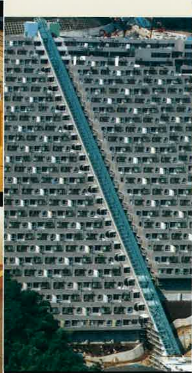
熱海バサニヤクラブ全寮(全273室検風呂) (静岡県)