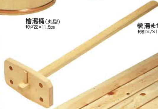
檜湯ませ(組立て式) 約61×7×10cm