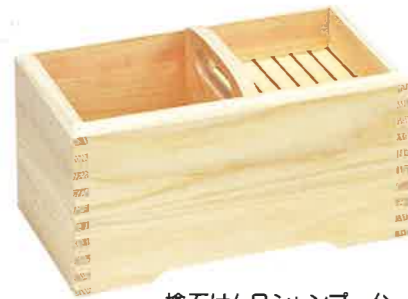
檜石けん&シャンプー台 約23×11×12cm