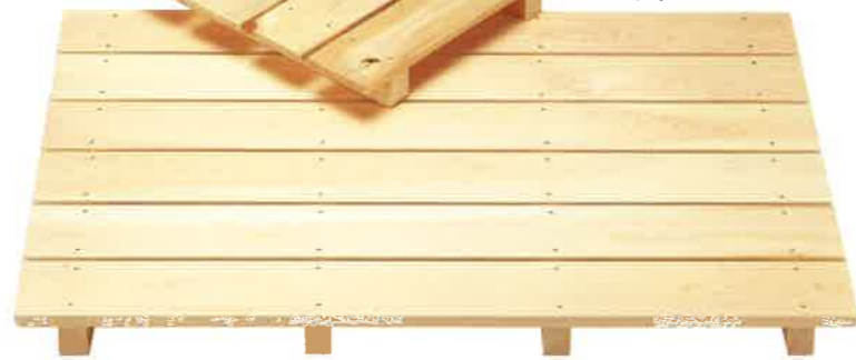
檜無地風呂すのこ6枚打 約88×58×5.5cm