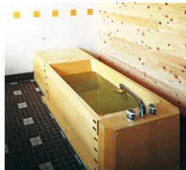
東京老人ホーム(東京都)