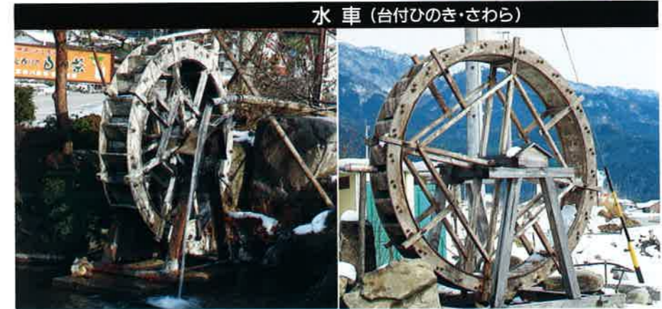
水車(台付ひのき・さわら)