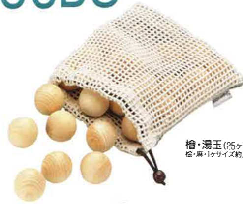
檜・湯玉(25ヶ)麻袋入 松・麻・1ヶサイズ約φ3.2cm