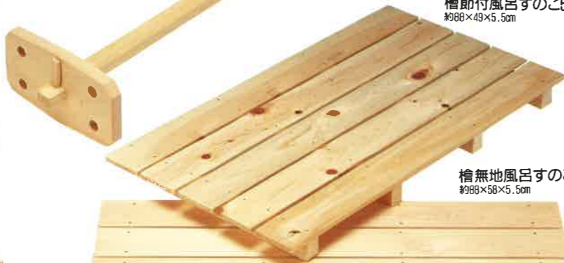
檜節付風呂すのこ5枚打 約88×49×5.5cm