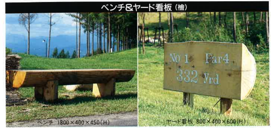
ベンチ&ヤード看板(檜)