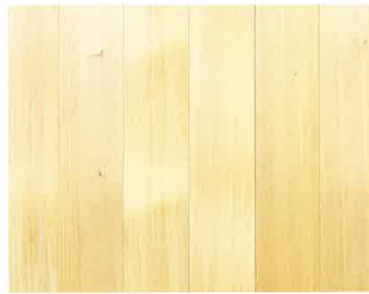
羽目板天井材 さわらOSカラー仕上 2000×110×12cm 3000×110×12cm