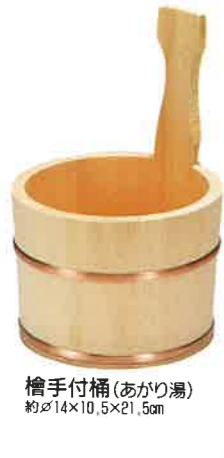
檜手付桶(あがり湯) 約φ14×10.5×21.5cm